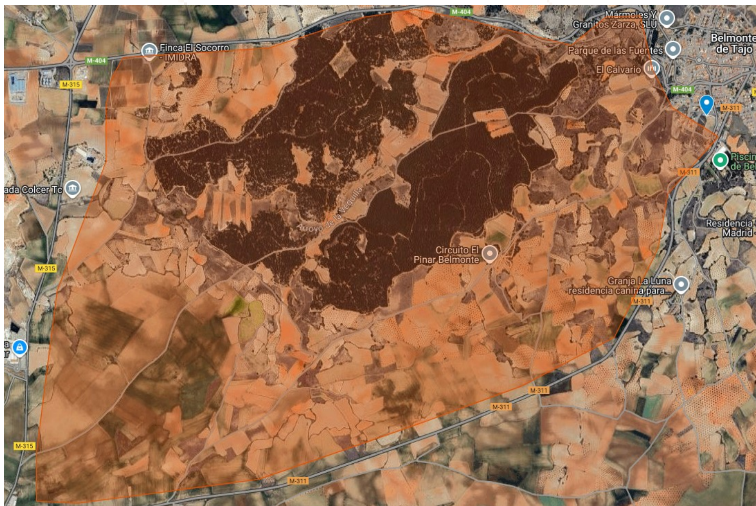
Localizaciones en google maps